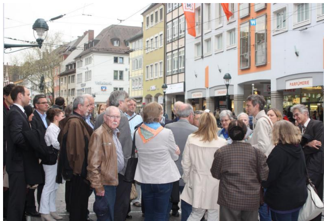
Photo : participants lors de la visite