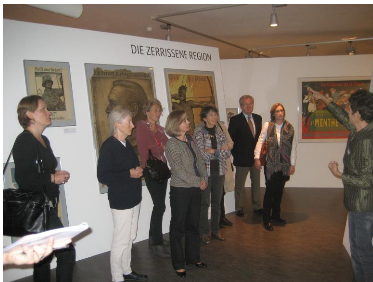
Photo : groupe lors de la visite de l'exposition « La Grande Guerre – La région déchirée »