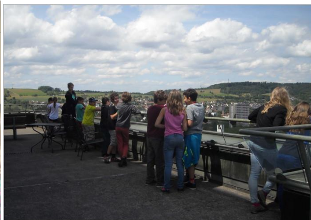
Photos : dans le Musée des Trois Pays (gauche), sur la terrasse panoramique de la Mairie de Lörrach (droite)