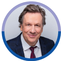
Jörg Kachelmann, Meteorologe

Wir bitten, wegen begrenzter Plätze um verbindliche Anmeldung bis zum 21. März 2025 unter info@regiotrirhena.org oder www.regiotrirhena.org/events